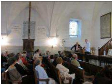
Conférence au temple de Baffignac

« Salut montagnes bien aimées » Montagne amie, refuge des huguenots, élévation vers Dieu : c'est un long compagnonnage que les protestants entretiennent avec les cimes, parfaitement raconté par Philippe Joutard lors de sa conférence du 12 juillet.