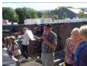
Cimetière protestant de Brassac

Le circuit organisé et piloté de main de maître par Marie et Rémi Chabbert a permis de découvrir ou de redécouvrir tour à tour Brassac, Castelnau-de-Brassac, Ouillats, Cambous, Sablayrolles, La Pierre Plantée... P. Muller