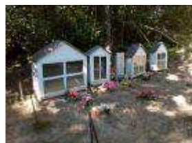
Vers Cruzis : Cimetière familial