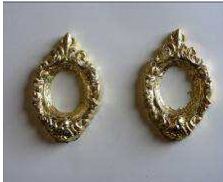
Dorure de cadres réalisée au cours de l'atelier par les enfants.